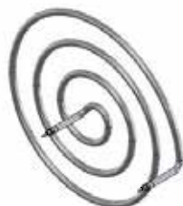
Beispiel 2 / example 2