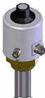
ERCH mit Regler / with controller