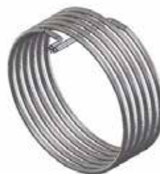
Beispiel 3 / example 3