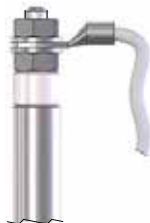
Beispiel 3 / example 3 RHK \varnothing 8,5 Gewinde M4 mit Kabelanschluss Tubular Heater \varnothing 8.5 M4 thread with leads