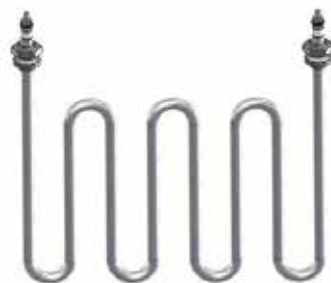
Beispiel 1 / example 1