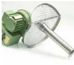
Trichter-Granulat-Trockner Hopper Granulate Dryers