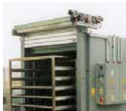
mit Rolltoren, Hub-, Klapptüren with Sliding, Lifting + Hinged doors