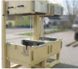
Durchlauföfen Conveyor Ovens