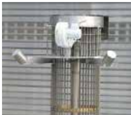
Tiegelbeheizungen Crucible Ovens