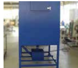
Silotrockner Silo Dryers