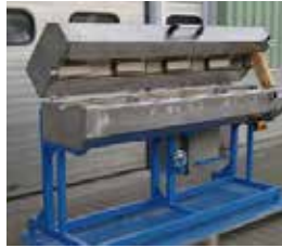
Durchlaufstrahler Transition Ovens