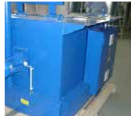
Truhenöfen Chest Ovens