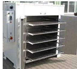
Schubladenöfen Drawer Ovens