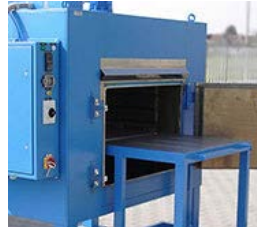
Herdwagenöfen ovens with charging trolleys