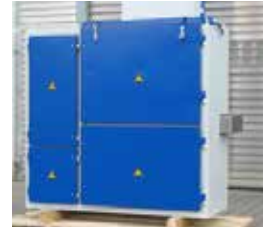
Labortrockner Laboratory Ovens