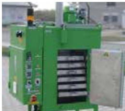
für Beschichtungsstoffe for coating materials